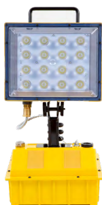
Guardian Zone I LED ..... 10