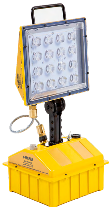
Guardian Zone I LED

Proyector portátil autónomo recargable con certificación ATEX, para uso en atmósferas explosivas de zonas 1, 2, 21 y 22. Con cuerpo en aluminio fundido a alta presión con recubrimiento especial, estanco, ligero y de gran resistencia para su uso en las condiciones ambientales más adversas. Versión fluorescente o led.