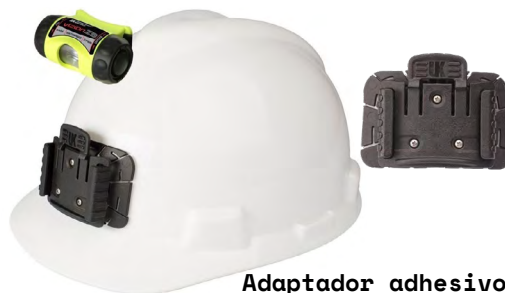
Adaptador adhesivo casco VIZION I-E (VIZION2)