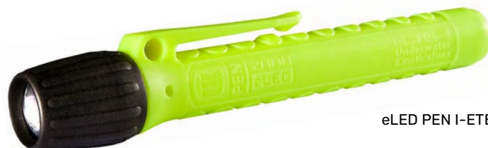
eLED PEN I-ETB