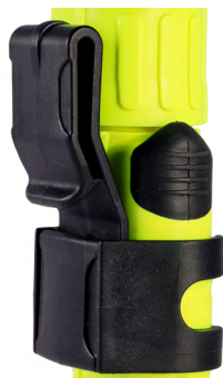
Clip para bolsillo