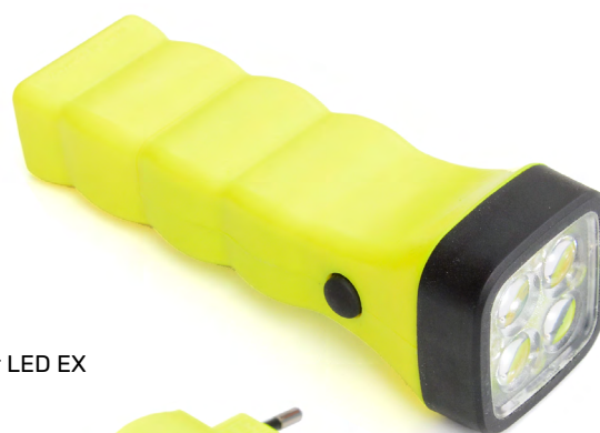
Four LED EX