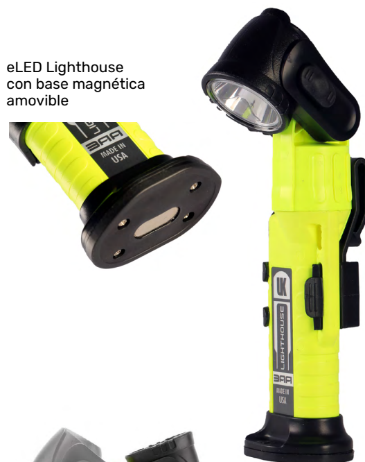
eLED Lighthouse con base magnética amovible