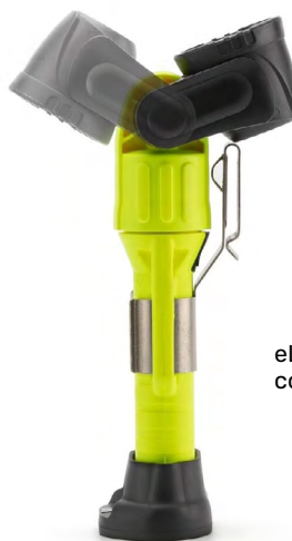
eLED Lighthouse con cabeza pivotante